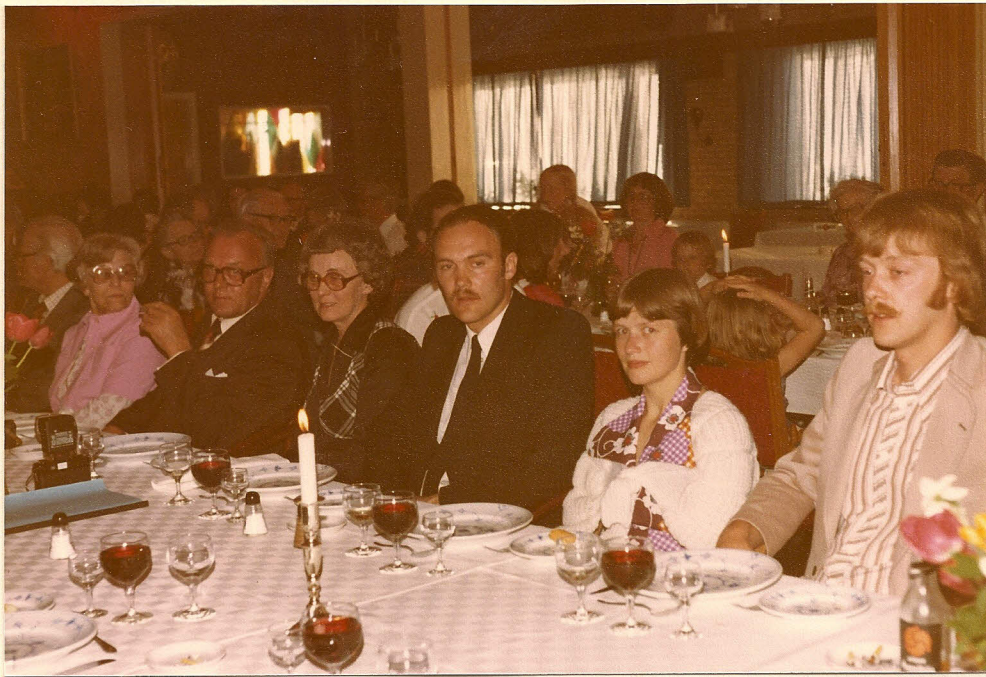
for Berge Holvik Asla Vendelin Wang begin of many Chr. chief of Henry Chr. Sleen Chr.